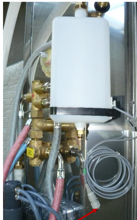
Connecteur femelle sur le bidon de produit désinfectant. (sur la paroi ou le panel)