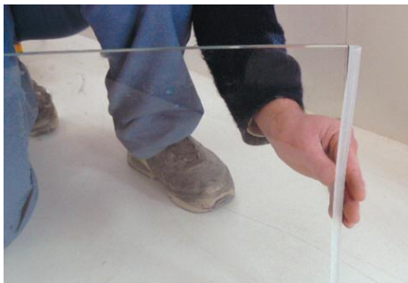
Ancienne version avec pose du profil PVC

Il suffit uniquement de placer le verre dans le profil cintre.